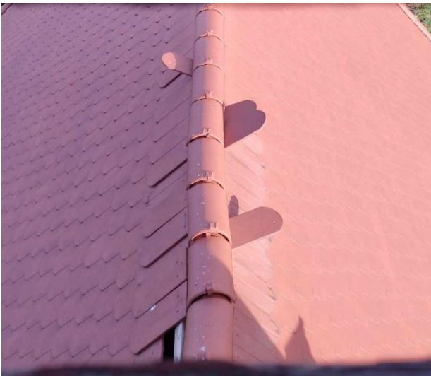
Meglazult cserepek a templomtetőn

Október 27-én a kora délutáni órákban szokatlanul erős vihar érte el vidékünket. Az erős szél több háznál és melléképületnél is okozott károkat. A templom tetőjéről is jónéhány cserepet lesodort, sőt, a kúpcserepek közül is meglazított, megemelt párat. Ezeket egyelőre sikerült pótolni, helyre tenni, de sajnos szakszerűen rögzíteni belülről nem lehet. Nagyobb beavatkozás esetén mindenképpen szakemberrel kell javítani a tetőt. A temetőbe vezető járda mellett is letört egy nagyobb ág az egyik hársfáról, szerencsére itt anyagi kár nem keletkezett.