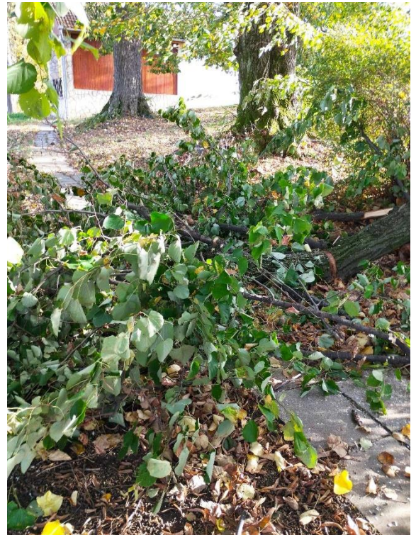
Letört faág a temetőben

szorultak, ezek javítását már nem lehetett tovább halasztani. Az önkormányzat a javításra megbízott vállalkozóval még november folyamán megállapodott, az meg is történt a hónap végén. Sajnos a kultúrházon a tető (és jónéhány egyéb elem) régóta felújításra szorul, ez azonban komoly beruházás lenne, melyet önerőből semmiképpen sem tudunk elvégezni. A Magyar Falu program keretein belül már több ízben is benyújtottuk a pályázatot az épület felújítására és korszerűsítésére, viszont egyelőre ezekkel nem jártunk sikerrel.