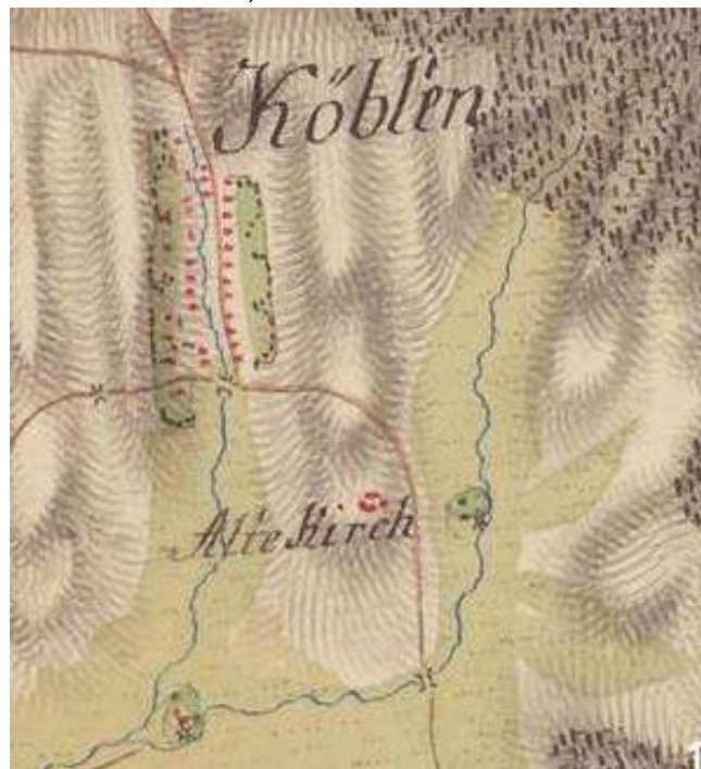
Köblény az első katonai felmérésen

indult be az élet. 1733-ban készült egy újabb összeírás az akkori állapotokról, amely megemlíti a köblényi romokat: egy nagy terjedelmű, kőből és mészből épült templomról írnak, melynek je-lentős része már összeomlott, csupán egyetlen falrész állt még az északi olda-lon. Az 1738-as kánoni látogatás meg-említi a templomról, hogy az akkori temetőben álltak a romjai, mellette egy kereszt és egy harangláb található (1). Az 1780-1784 között készült első kato-nai felmérésen feltüntetik a falu mel-lett fekvő középkori templomot („Alte Kirch”-néven).