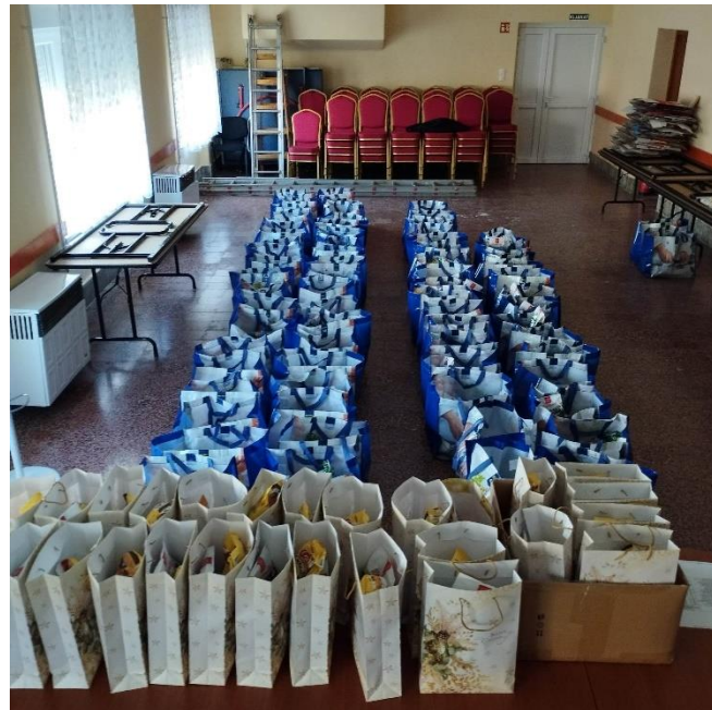
Élelmiszercsomagok és ajándékok a faluházban

Ezen kívül minden falubeli háztartás átvehet egy tartós élelmiszer csomagot, melyet az ünnep előtti héten fogunk kiszállítani mindenkinek. A csomagra fordított keret nem változott jelentősen, viszont az árak komoly emelkedése miatt a tavalyinál valamivel szerényebb csomagot tudtunk kihozni az összegből. Reméljük, hogy az ünnepi készülődéshez mindenkinek hasznos kiegészítés lesz az önkormányzat ajándéka, amelyben az alapvető élelmiszereken kívül 1-1 csomag szaloncukor is helyet kapott.