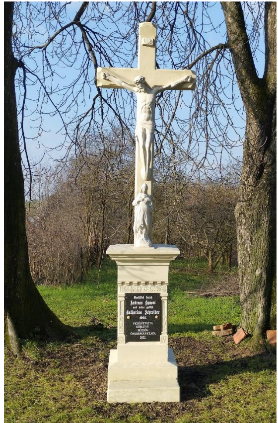
A templom előtt felújított kereszt

A Mecsek-Völgység-Hegyhat Egyesület által kiírt, a LEADER program keretein belül elnyert pályázatunkkal négy belterületi emlékkereszt teljeskörű megújítása vált lehetővé. A templom előtti, a Kossuth és Béke utca találkozásánál álló, valamint a temetőben lévő két kereszt felújítása befejeződött. A kivitelező a váraljai Amrein Kft. volt. A munkálatok során az emlékkeresztek felületének kijavítása, csiszolása, impregnálása megtörtént, az eredeti feliratok szövegének megőrzésével új márványtábla került fel. A keresztek mindegyike a környékünkön viszonylag könnyen hozzáférhető homokkőből készült. A szakértői munkának köszönhetően a műtárgyak jelenleg az eredeti anyag természetes színét nyerték vissza.