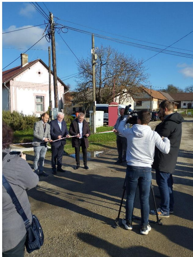
A megújult csapadékvíz elvezető átadása

Ft, mely községünk éves költségvetéséhez viszonyítva is újabb kimagasló eredmény. A projekt keretein belül megvalósulhat a teljes árokszakasz korszerűsítése a hozzá kapcsolódó hidak és átvezetők megújításával együtt. Egészen a forrástól (egykori községkút) a befogadó, már felújított árokig kialakításra kerül az új burkolat, mely a hirtelen lezúduló felhőszakadások esetén is hatékonyan vezetheti el az esővizet. A pályázattal kapcsolatosan egyelőre csak az eredményközlés valósult meg, amint lesz pontosabb menetrend a kivitelezés megkezdéséről, a munkálatok üteméről, természetesen részletes tájékoztatást adunk.