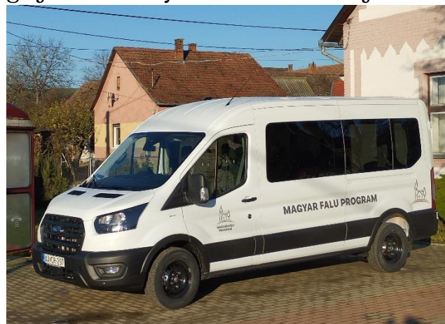
Az új falubusz

Szintén átadásra került a Magyar Falu Program keretein belül elnyert új, Ford Transit V363 (Kombi) típusú, 9 személyes falubusz, melynek beszerzéséhez 14 973 000 Ft összegű támogatás nyert községünk. Az eddig használt autóbusz műszaki állapota komoly problémákat okozott az elmúlt években, amelyek miatt számos esetben nem tudott indulni a falugondnoki járat, a javítás pedig komoly költséget jelentett az önkormányzatnak. Az új falubusz beszerzése tehát égetően fontos volt már, ezért is fogadtuk nagy örömmel az új járművet. Bízunk benne, hogy nagyon sok balesetmentes kilométer vár rá, és hosszú ideig szolgálja a köblényiek érdekeit az új busz.