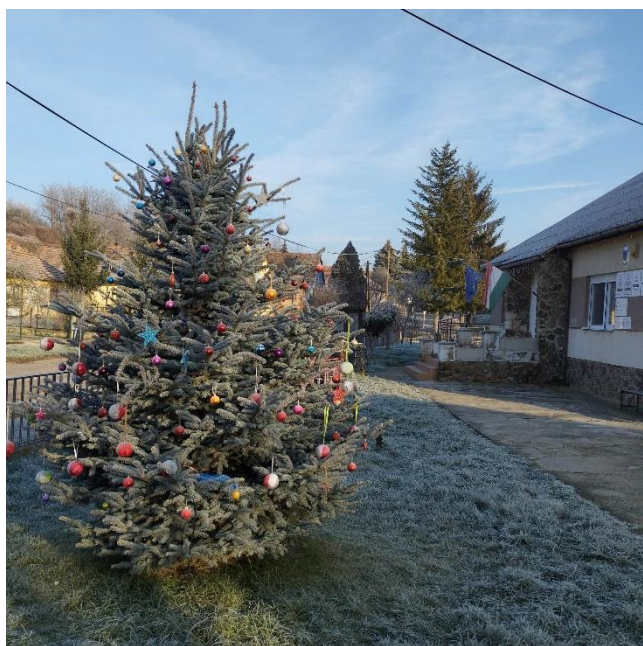
A feldíszített fenyőfa a faluház udvarában

Ahogy minden évben, úgy idén is minden köblényi gyermeknek eljuttatjuk az önkormányzat karácsonyi ajándékát. Ezúttal a tárgyi ajándékok helyett mindenki komoly összegű vásárlási utalványt kapott, kiegészítve természetesen édességekkel és gyümölcscsel.