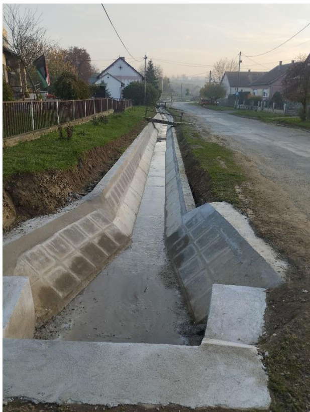
A megújult árokszakasz

Befejeződött a Kossuth utca belterületi vízrendezése 605 m-es szakaszon, melyre Köblény összesen 100 millió forint vissza nem térítendő támogatást kapott. A pályázattal az önkormányzat a település belterületi csapadékvíz elvezetési rendszerének fejlesztését, a csapadékvíz kár veszélyeztetettségének csökkentését és a káresemények megelőzését tűzte ki célul.