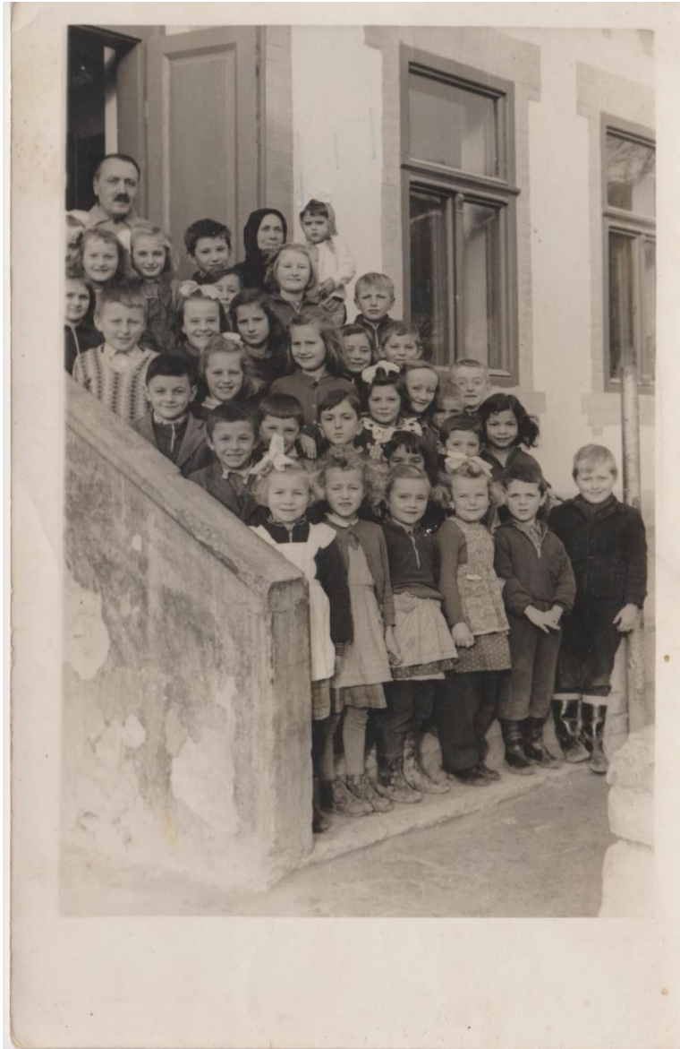
A köblényi iskola alsó tagozatos diákjai kb. 1958-59-ben.

Szeretnénk néhány régi fényképpel, egy-egy régi eseménnyel felidézni falunk történetét. Ezúton is biztatunk mindenkit, hogy akinek a faluról, annak bármely részéről, házaról vagy a környékéről régi fényképe van otthon, és azt szívesen megosztaná, kérjük jelezze az önkormányzatnál. Sok olyan kincs lapul néha a fiókok mélyén, ami nagyon sok régi emléket felidézhet.