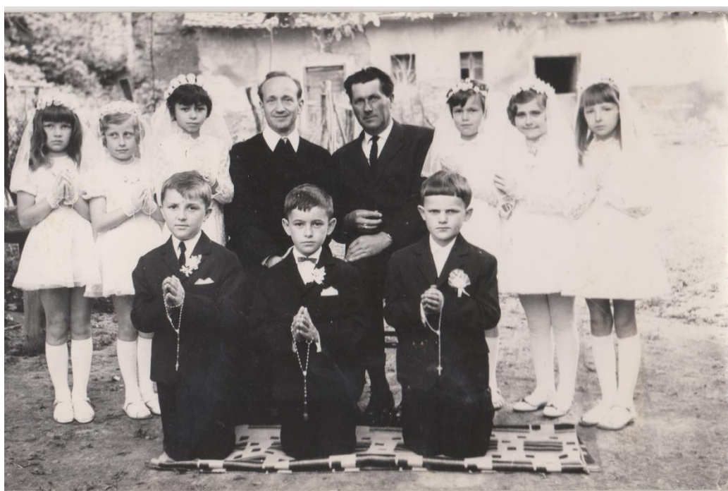
Köblényi elsőáldozók (1970.06.07)