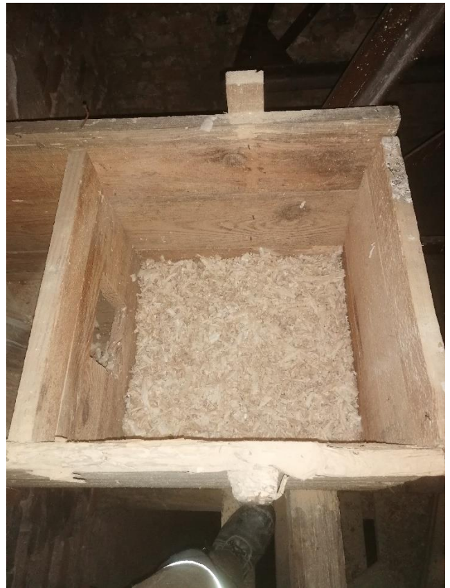
A költőláda belső tere forgáccsal bélelt

2003 óta tehát mindkét költőláda lakatlan, azóta egyszer sem költöttek baglyok a templomtoronyban. A hosszú szünet mögött valószínűleg nem helyi tényezők állnak.