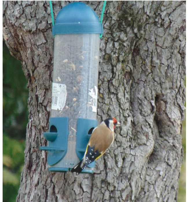
Tengelic az etetőn

A madarakat célszerű tavasszal a fagyok elmúltáig etetni, tehát nagyjából március közepén, végén a legjobb befejezni.