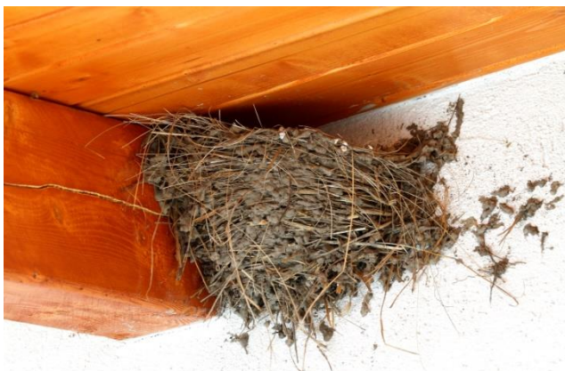
Füsti fecske felül nyitott fészke

Magyarországon három jellegzetes fecskefaj fészkel: a füstifecske, a molnárfecske és a part fecske. Ezek hosszú távú vonuló madarak, vándorlási útvonaluk átszelik a Szaharát, ismert telelő területeik Közép- és Dél-Afrikában vannak. A parti fecskék főleg folyópartok, homokbányák partfalába vályva fészeküregeit, a felmérés ezt a fajt nem érinti.