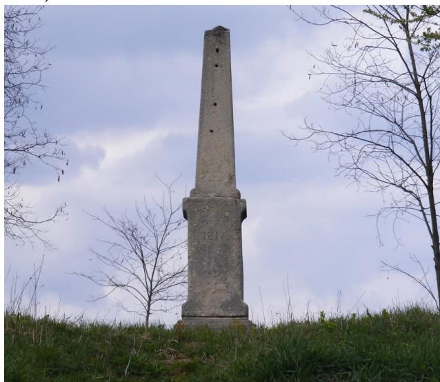
A leromlott állapotú régi kereszt

A Kossuth-utca felső végében álló régi kereszt állításának körülményeit szerencsére egy levéltári feljegyzés pontosan rögzítette, így azt ismerjük. A kőkeresztet 1817-ben állíttatta Marschal Ferenc, a pécsi szeminárium uradalmi fővadásza, aki a munkálatok minden költségét magára vállalta. A köblényiek pedig vállalták, hogy az állítandó kőkeresztet megőrzi és folyamatosan karbantartják. (Arról nincs információ, hogy a keresztet állíttató fővadásznak volt-e bármilyen kötődése Köblényhez?)