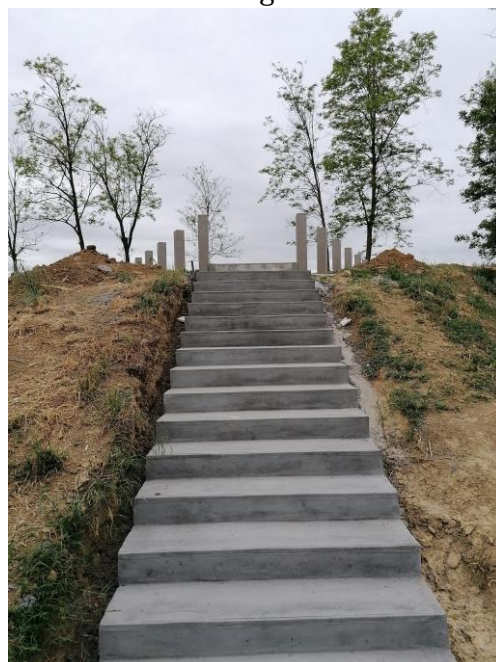
A kialakított új lépcső

A kereszt állítása óta eltelt 200 évben viszont a műemlék állapota annyira leromlott, hogy már hosszú ideje csak a csonk és talapzat szürke maradványai álltak a helyükön. A talapzaton még kivehető volt az 1817-es évszám, az egykori felirat viszont már egyáltalán nem látszott. A szakértői vélemények alapján a csonk restaurálása, eredeti formájának visszaállítása sajnos már nem lehetséges.